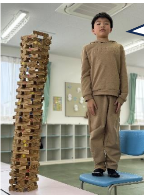
カプラ 高い! すごいでしょ