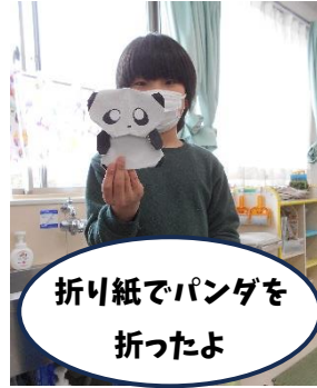
折り紙でパンダを折ったよ