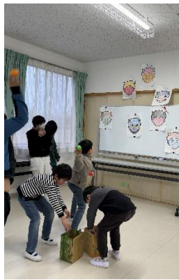
節分! 鬼の面を作って鬼退治だー